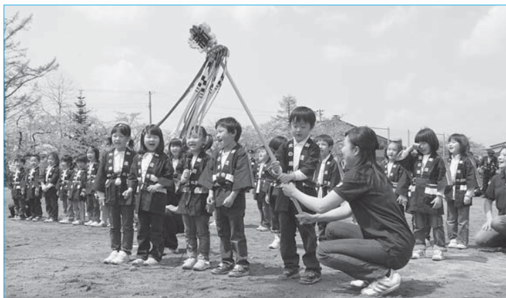
▲春季消防演習でパリス保育園児が防火の誓いを披露(5月3日/新庄中グラウンド)

市内17分団約1,200人の団員が参加して春季消防演習が行われました。分団ごとに行進した後、新庄中グラウンドで操法や訓練礼式の基本動作を点検。パリス保育園の子どもたちが元気なダンスと防火の誓いを披露。最上公園での一斉放水では、勢いよく伸びる水柱に見物客から大きな歓声があがっていました。