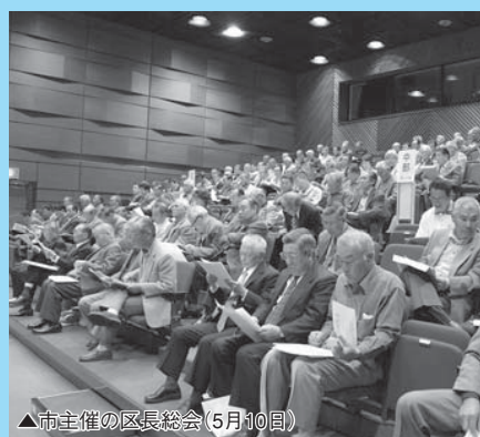
▲市主催の区長総会(5月10日)