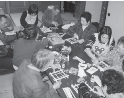
▲末広町公民館で開催された“みんな集まれ!一緒に遊ぼう!!”

この事業は、各地域公民館を巡回し、お茶飲みや遊び・学びの場を提供することで、子どもから大人、お年寄りが顔見知りになり、地域の助け合いや見守りにつなげていくことを目指しています。また、核家族化が進む中、このような場を持つことにより育児の悩みを相談できたり、子どもとお年寄りが触れ合うことにより子どもたちの健全な育成が図られると考えています。