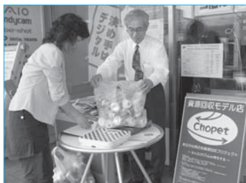
▲市民活動団体と中心商店街が資源回収プロジェクトを始動(5月30日/中心商店街)