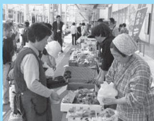
▲もてなし金よう市でにぎわう北本町商店街

場所ではなく、市民活動の支援も含めた地域の皆さまが気軽に集える場所として再生していくことが、いまこそ求められていると感じています。