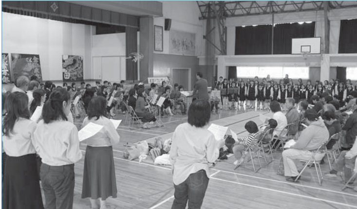
▲雨天のため新庄中体育館で開催された水辺のコンサート(5月20日/新庄中)