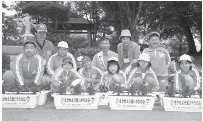
▲人権の花運動(5月18日/北辰小学校)

子どもや女性、高齢者に対する暴力など人として生きる権利が脅かされる事件が後を絶ちません。このような社会のなかで、広く市民に人権尊重の理念を普及させ人権に対する理解を深めてもらうと「市民提案型新庄地域人権啓発活動活性化事業」が行われています。