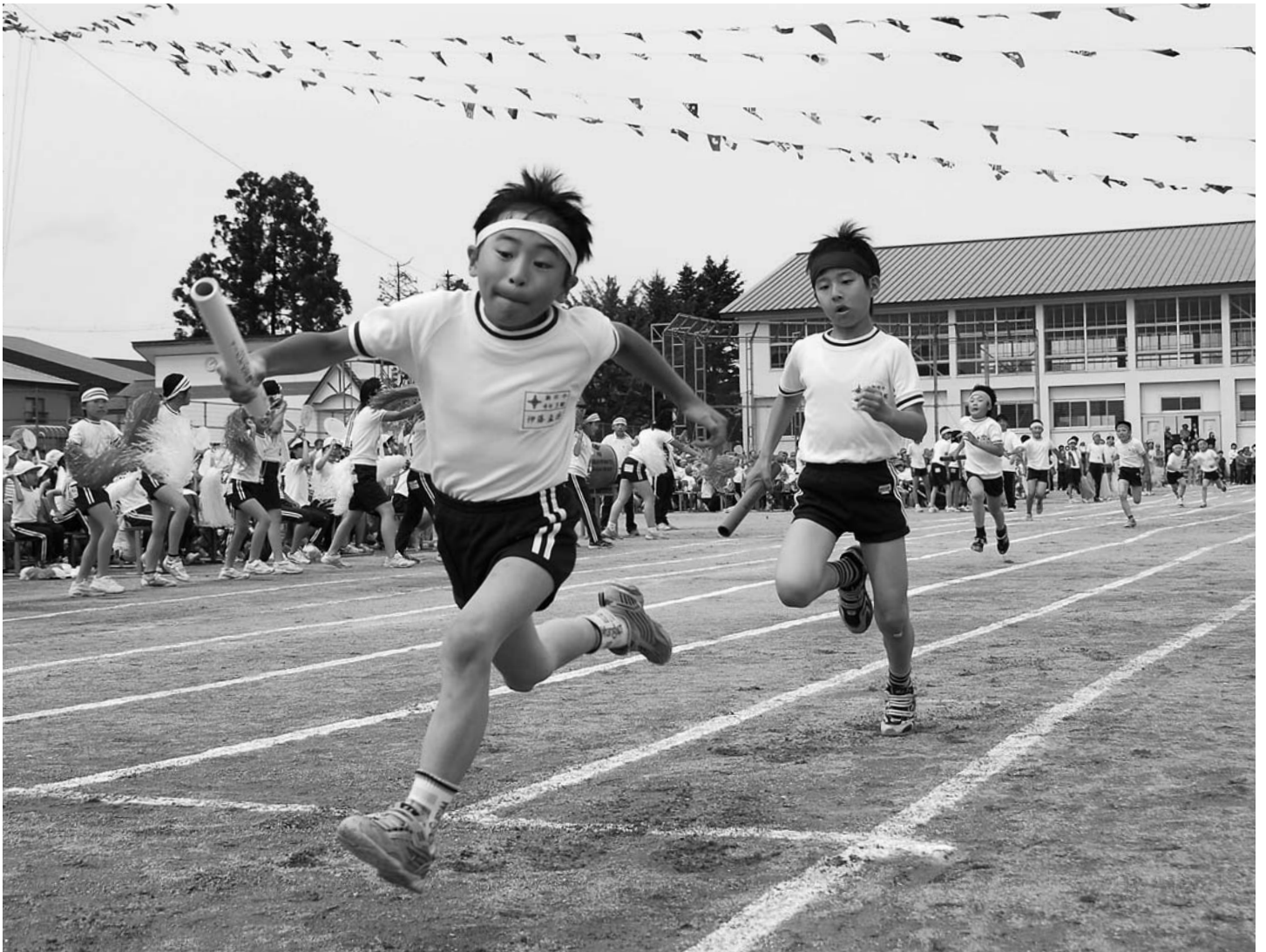
新庄小学校大運動会(5月26日/新庄小グラウンド)