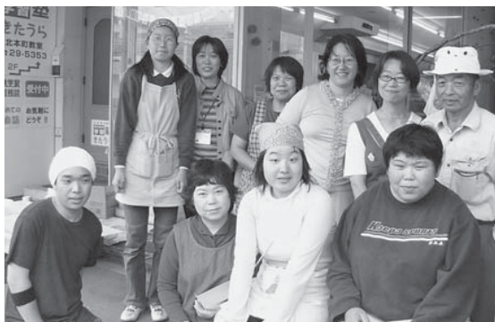
▲福祉サポートセンター山形のNPO会員

また、センター前では、NPO会員が「ドリカム・日替わり市場」を開催し、曜日ごとに産直野菜や手づくりアクセサリー、衣類、パンなどを出店しています。