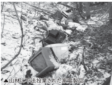
▲山林に不法投棄された家電製品

普段みなさんは、きちんとごみ出しのルールを守って、または必要な金額を払ってごみを処理しています。しかし、公