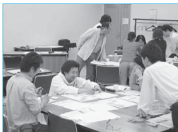
▲ワークショップを深めると題して市民活動スキルアップ講座を開催(5月20日/市民プラザ)