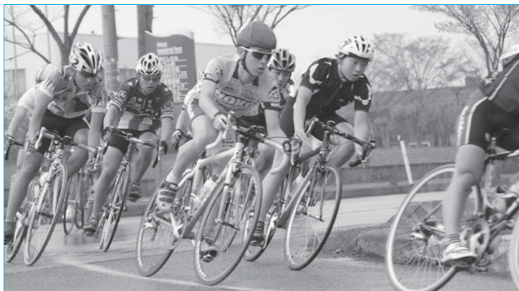
▲第15回クリテリウム新庄大会(5月5日/中核工業団地)

第15回クリテリウム新庄大会が中核工業団地特設コースで開催されました。レースは10クラスで行われ、県内外から7歳から66歳まで168人がエントリー。公道に設けられた特設コースで、ゴールを目指しスピードとコーナリング技術を競い合いました。