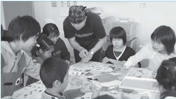
▲親子折り紙教室を開催した第1回ぶらっとカフェ(5月12日/市民プラザ内ぶらっと)