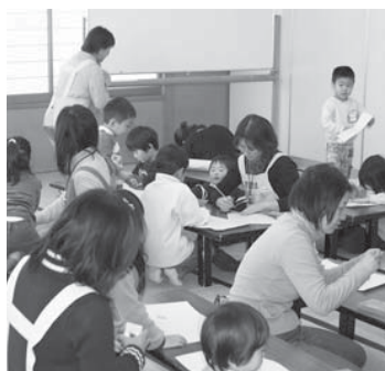
▲自主事業として開催した「ババと一緒に遊ぼう！」

所があることで、いろいろな人に自分たちの活動を知ってもらうことができました。自分たちも子育てをしなからの活動ですが、働きながら子育てしているお母さん・お父さんが安心して仕事と育児ができるお手伝いをしていきたいです」と語っています。