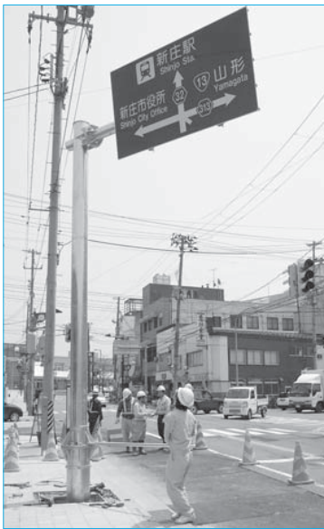
▲県内初の回転式道路案内標識を設置(5月9日/駅前五差路)