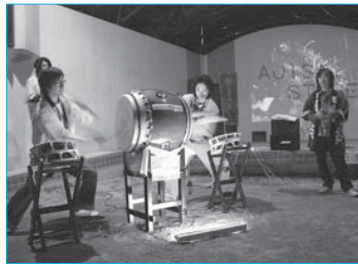
▲市民有志によるまつり囃子演奏(5月5日/最上公園)