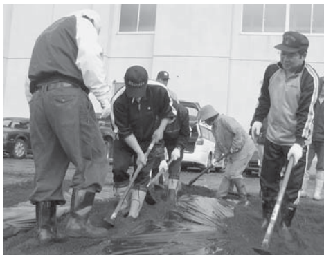
▲親子奉仕活動での花壇づくり

厚生部では、体育行事への支援を中心に、PTA親善グラウンドゴルフ大会の企画運営を行い、会員の親睦を図っています。