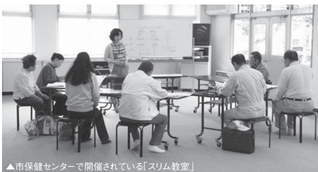
▲市保健センターで開催されている「スリム教室」