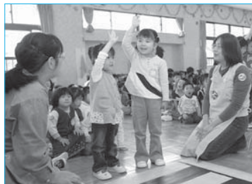
▲春の交通安全県民運動期間中に開催された「かもしかクラブ」で保育園児に交通安全指導(5月15日/中部保育所)