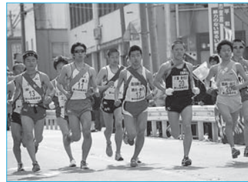
▲第54回県縦断駅伝2日目新庄スタート(4月28日/市役所前)