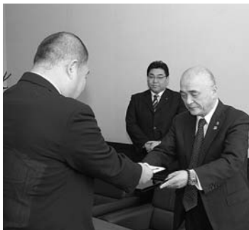
▲ライオンズクラブからの寄付(4月11日)

図書の充実を図りながら、教育力の向上、児童・生徒の読書への関心を高める施策を、今後も積極的に取り入れていきたいと考えています。