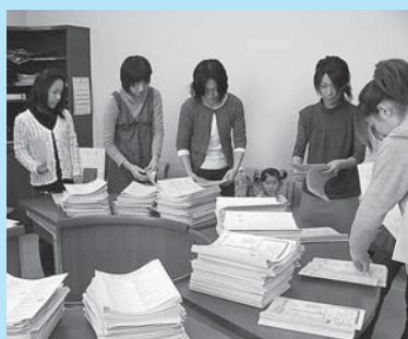
▲ママたちが集まって手づくりで製本しました

モットーは「無理なく楽しく」。ママたちの「ママたちによる、ママたちのための情報誌『ママ・ナビ』。あなたも参加してみませんか?」