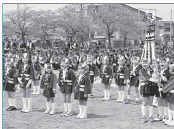
▲春季消防演習で新庄幼稚園の園児たちが防火の誓いを披露(4月27日/新庄中学校)