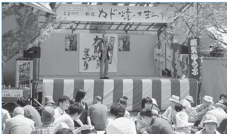
▲カド焼きまつり(4月29日～5月5日/最上公園)