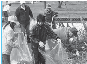
▲ボランティア清掃(4月20日/最上公園)