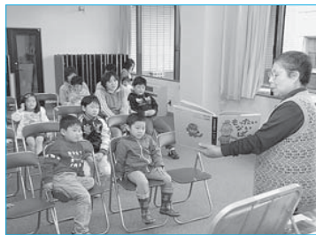
▲市立図書館「おはなし会」(4月12日/市立図書館)