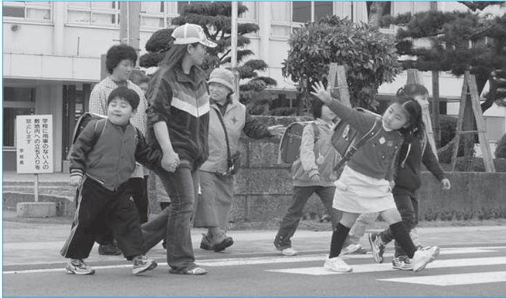
▲新入生交通安全指導(4月9日/新庄小学校)