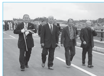
▲野中・谷地小屋ふるさと農道事業で整備された「緑の絆橋」の開通式(4月14日/野中地内)