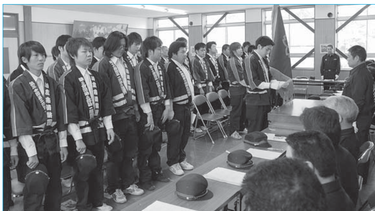
▲市消防団新人団員辞令交付式(4月5日/東山スポーツハウス)