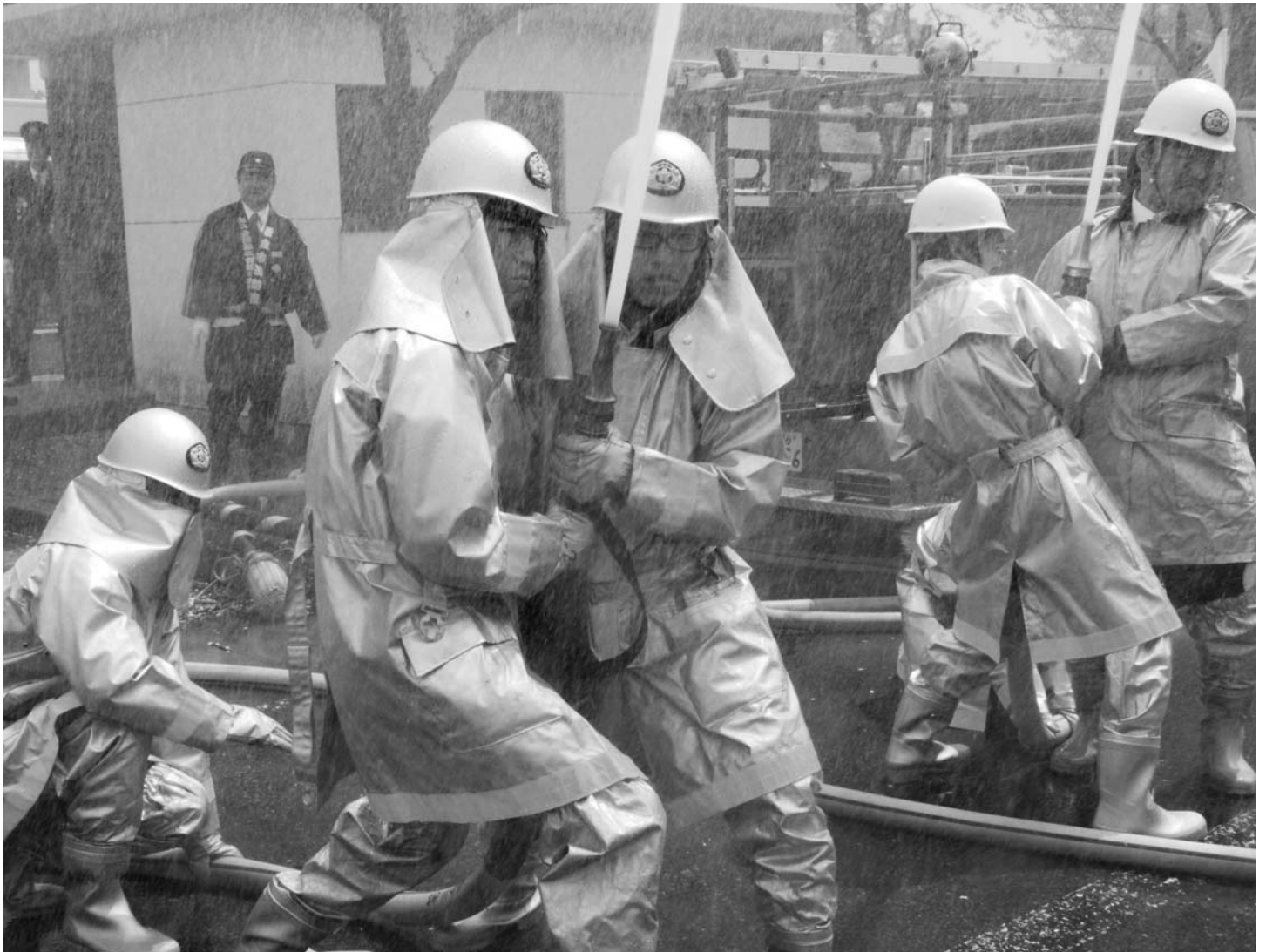
市春季消防演習(4月27日/最上公園)