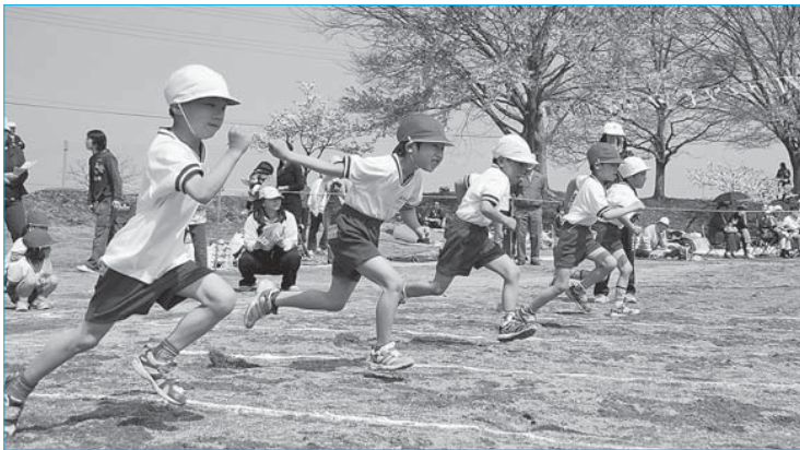
▲泉田小学校大運動会(4月29日/泉田小学校)