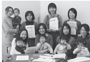
◎ママナビ編集委員会・事務局 新庄TCM株式会社内 ☎22-6855

「ママ・ナビ」が生まれたのは今から五年前。それまで子育てに関する情報源が口コミしかなかったこの地域で「子育て中のママたちに役立つ情報誌があったらいいな」とこんなママたちのつぶやきがきっかけでした。