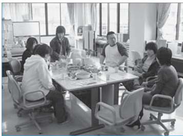
▲ぶらっとオープンカフェでぶらっとサポーターと会員の交流(4月5日/ぶらっと)