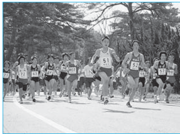
▲第25回新庄・最上地区春季ロードレース(4月6日/陸上競技場周辺)