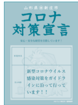
かむてん版(オレンジ)