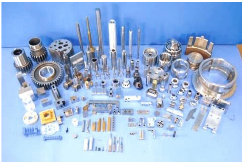
当社納入部品の一部