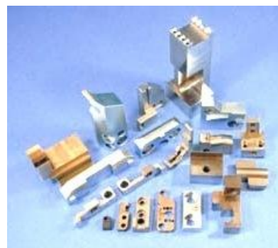
搬送機器用の爪（フィンガー各種）