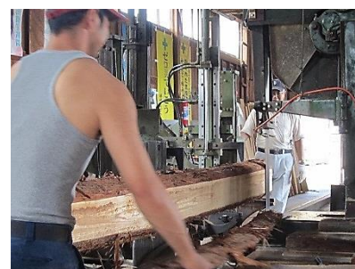
帯鋸盤での作業風景