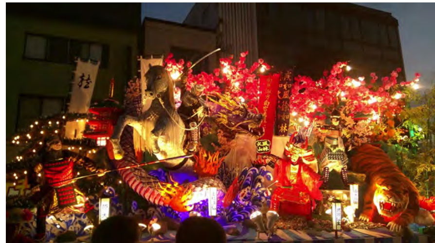
新庄まつりの山車（千門町）