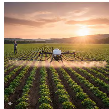
二等無人航空機操縦士 （イメージ）