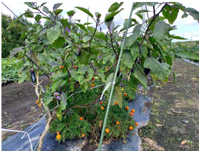
ナス（真仙中長）（令和6年9月19日）