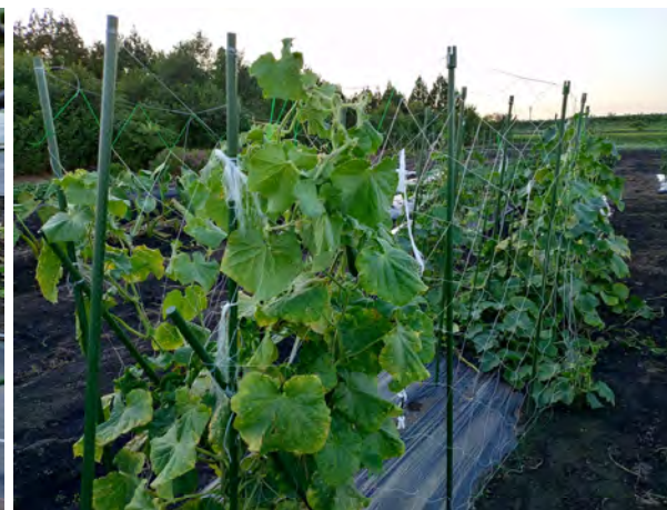
キュウリ（令和7年8月9日）