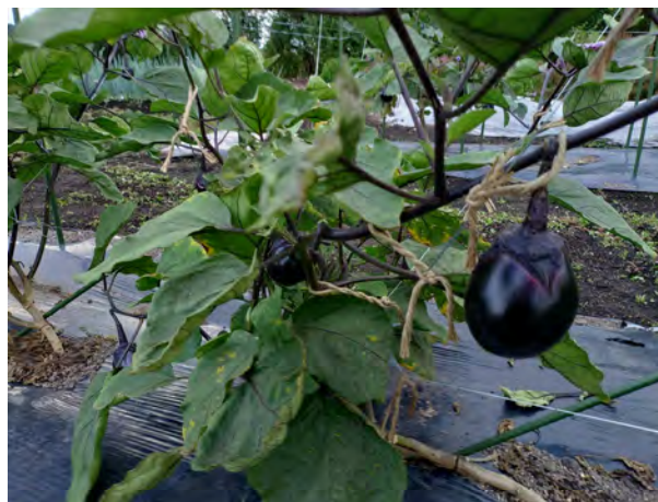
畑ナス（令和7年8月31日）