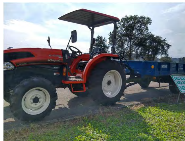
けん引免許（農耕車限定）講習