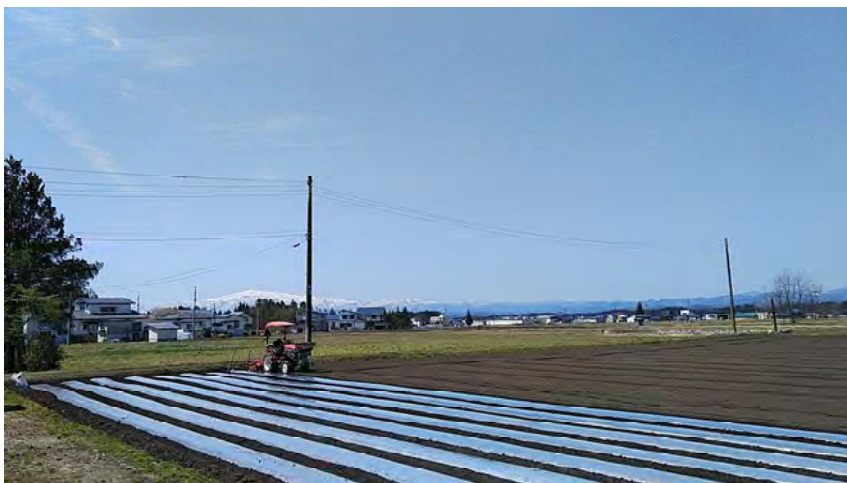
マルチの張られた里芋の畑