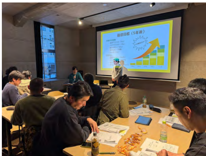
新規就農者向けの研修