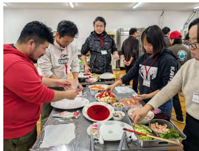
グリーンツーリズム・ インストラクター研修の様子