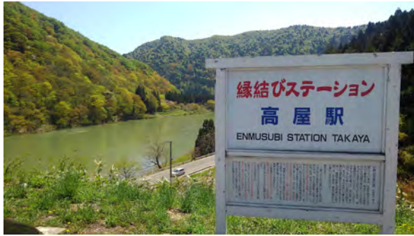
高屋駅前から見た最上川 (戸沢村)