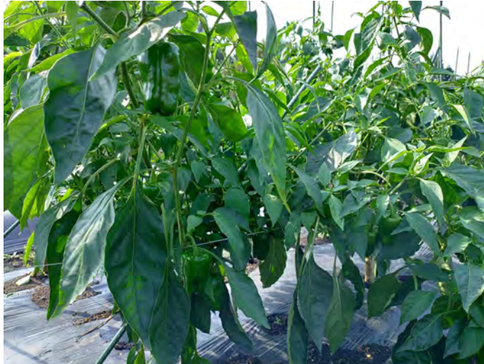
ピーマン (令和7年9月1日)