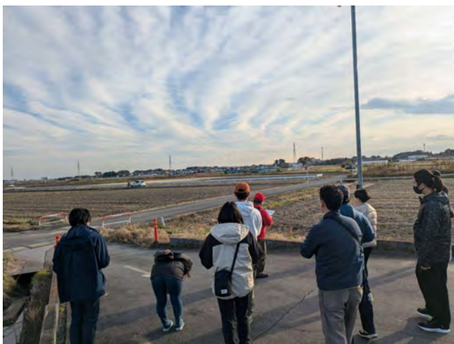
グリーンツーリズム・ インストラクター研修の様子