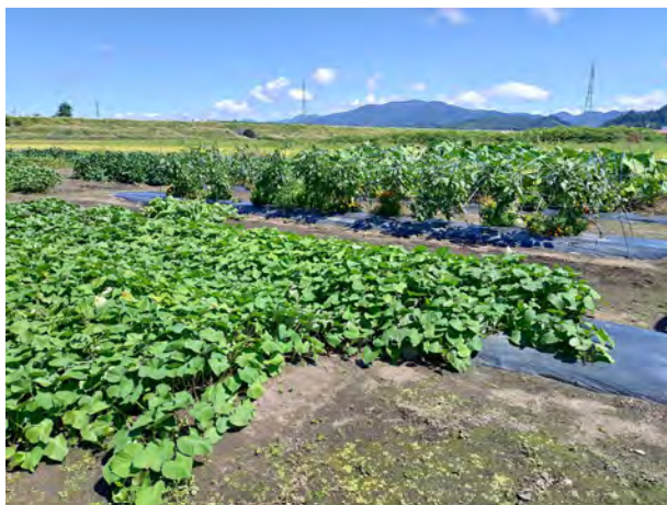
西側から見た圃場