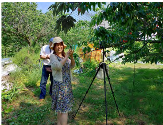
さくらんぼ狩りのイメージ