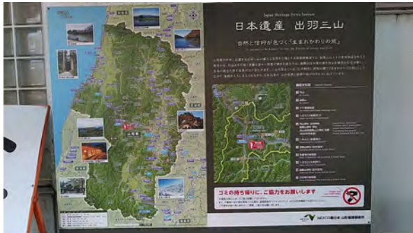
月山湖PAにある出羽三山の紹介 (西川町)