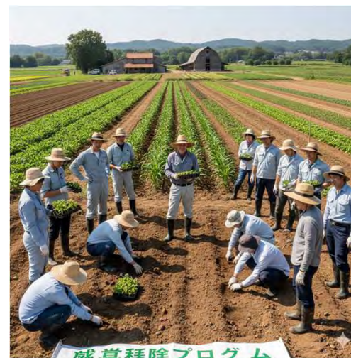
新規就農希望者の支援（イメージ）