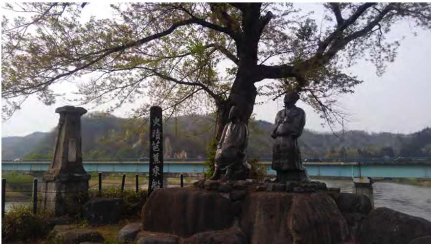
史蹟芭蕉乗船之地（新庄市本合海）

母方の祖母が新庄市本合海に住んでいて、幼少の頃より、新庄まつりの時期を中心に、何度も新庄に帰省していた。