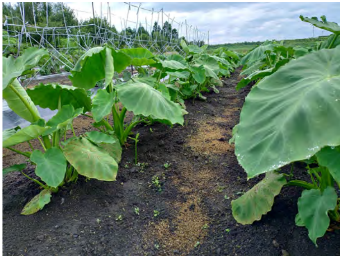
里芋とショウガ（令和6年7月7日）