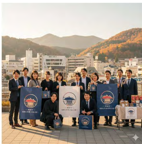
地域おこし協力隊の支援（イメージ）