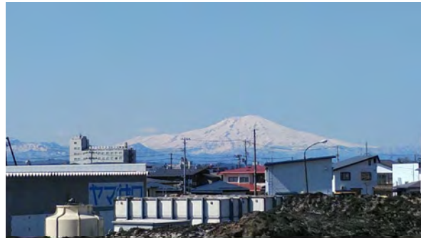
新庄市内から見た鳥海山 (西川町)