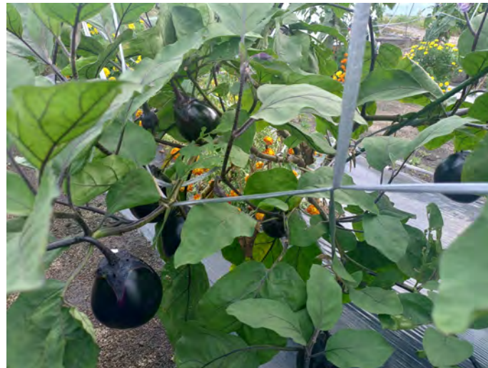
ナス（畑ナス）（令和6年8月30日）