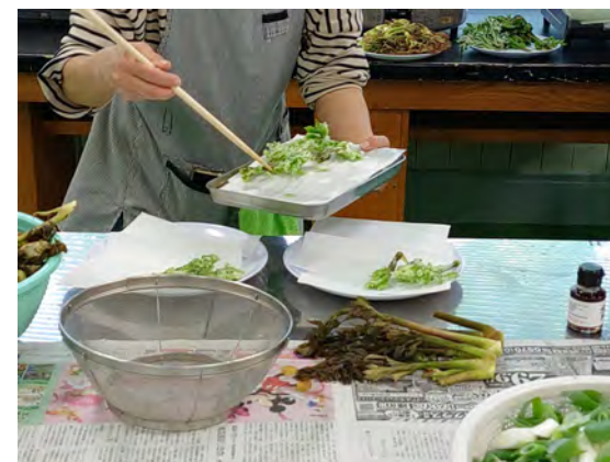
山菜の天ぷら体験