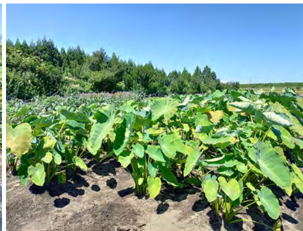
東側から見た圃場