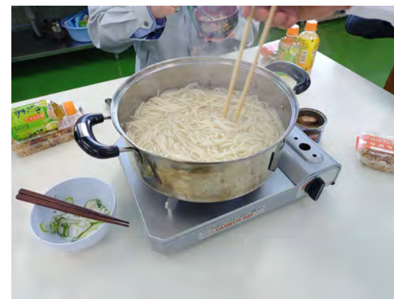
ひっぱりうどん体験