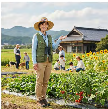
グリーンツーリズム ・インストラクター （イメージ）