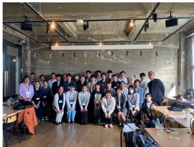
地域おこし協力隊向けの研修