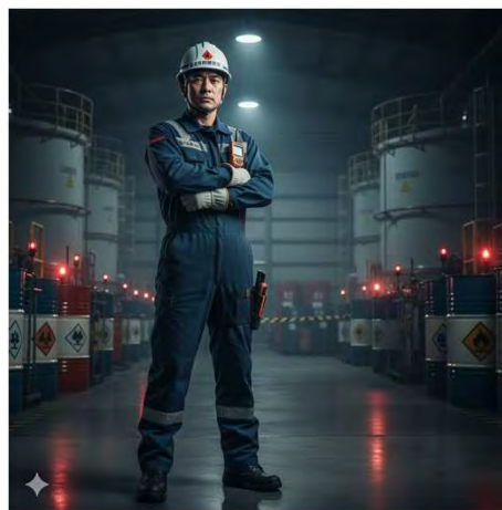
危険物取扱者 （イメージ）