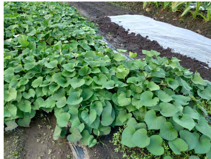
サツマイモ (令和7年9月14日)