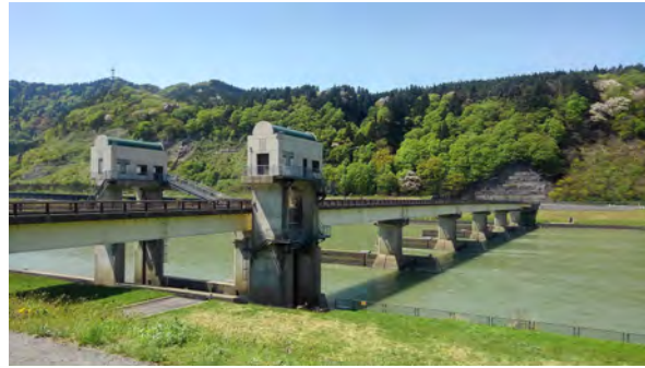
最上川さみだれ大堰 (庄内町・酒田市)