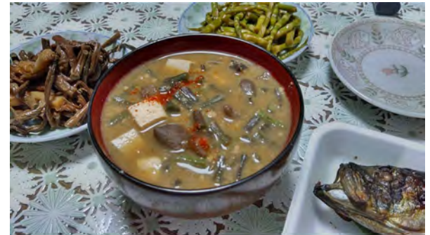
納豆汁、カド焼きなど (新庄市)