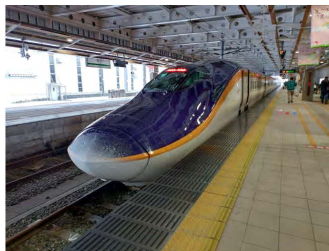
山形新幹線E8系つばさ