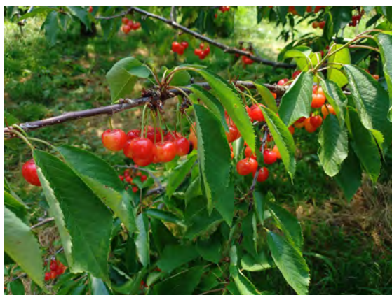
さくらんぼ狩りのイメージ