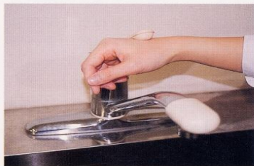
7. 水道の栓を止めるときは、手首か肘で止める。できないときは、ペーパータオルを使用して止める