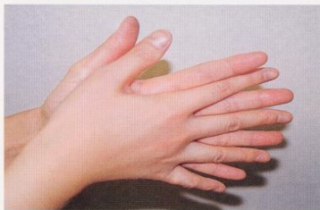
1. 手のひらを合わせ、よく洗う