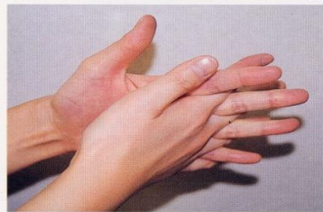
4. 指の間を十分に洗う