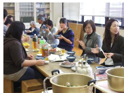
収穫したサトイモで「いも煮」を作り、お世話になった方に振舞いました。

11月は最上管内の中学2年生にとってとても楽しみな行事の1つが行われます。それは「修学旅行」です。大きな部屋での食事の様子や友だちとそろそろ歩いた記憶がきっとあると思います。しかし、シャイニングクラスの2人は級友とほとんど繋がっていない、担任ともあまり会わない・会えない今の状況では、ひょっこり旅行だけ参加するほど精神的に強くないから…と言うのが本音でした。何回かは学年主任・担任の先生が来室して学校・学級の様子や修学旅行の日程等について話をしてくださいましたので、修学旅行を機に次のステップへ…等と考えていただけに、現実の厳しさを突きつけられた思いでした。もうすぐ3年生。復帰・進路選択そして進学を考えると何とかして2人の心を動かし、行動に移していく方法をみんなで相談し、模索していきたいと強く思っている今日この頃です。