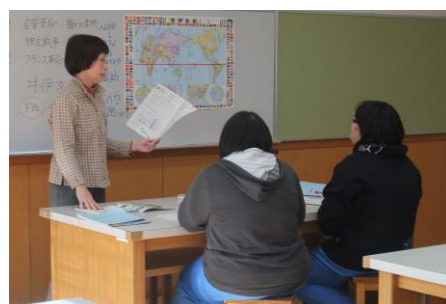
シャイニングクラス・社会科の授業