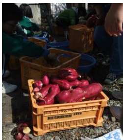
収穫したサツマイモは28kg