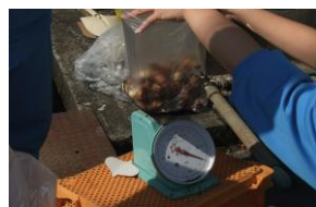
収穫したサトイモの 袋詰め作業 (10/9)