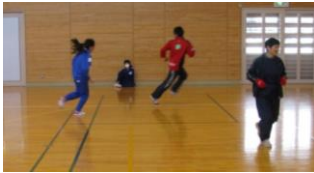
ハードな鬼ごっこ

十分な準備体操で体をほぐして暖めた後に、基礎的トレーニングと全力疾走を要するゲーム、縄跳び、球技等を組み合わせたメニューで息が上がるほどの運動量を確保しています。(相談員も限度一杯で動いています。)