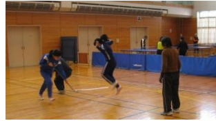
敏捷性とジャンプ力を