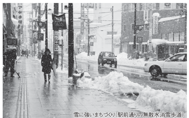
雪に強いまちづくり(駅前通りの無散水消雪歩道)