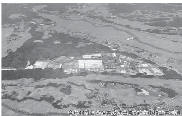
今年44社目の企業が進出する新庄中核工業団地