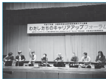
▲キャリアアップフォーラム(12月10日/市民プラザ)