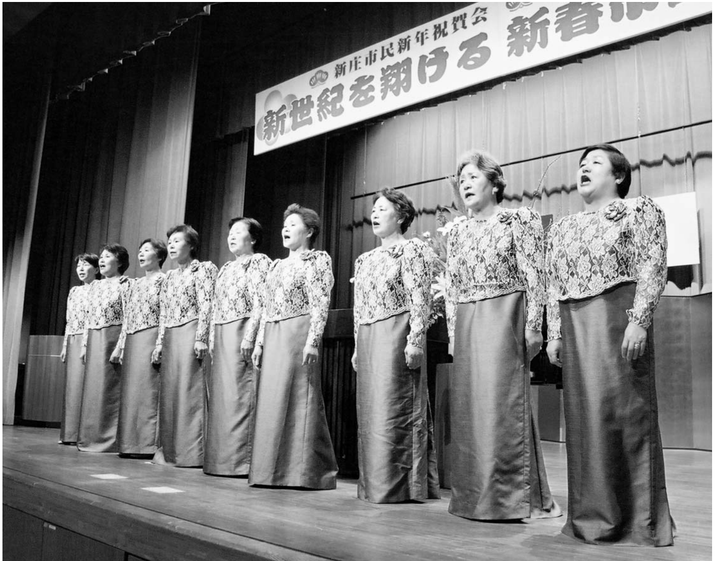
新春市民の集い(1月4日/市民プラザ)