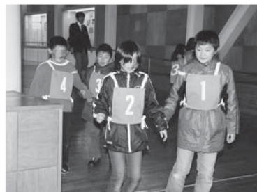
バリアフリー教室(11月30日/新庄駅)

「指一本でもボランテアはできません。障害者がエレベータの前で困っていたら指一本差し伸べて、言葉をかけてください」とあいさつがありました。国の担当者は、「今回の体験で心のバリアフリーを育んでほしい」と話しています。