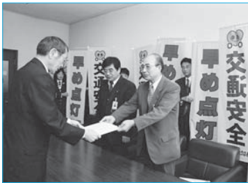
▲新庄郵便局長から市に交通安全のぼり旗寄贈(12月13日/市役所)