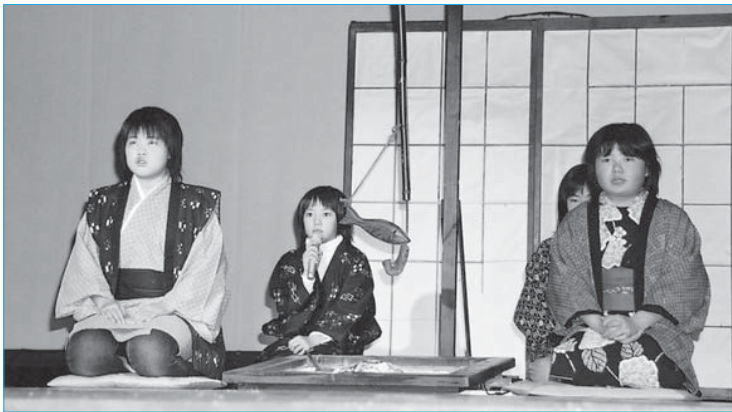
▲活動の成果を披露した泉田フェスティバル(12月18日/市民プラザ)