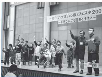
▲障害者も健常者も手をつなごうと開催された一歩?フェスタ(12月2、3日/ゆめりあ)