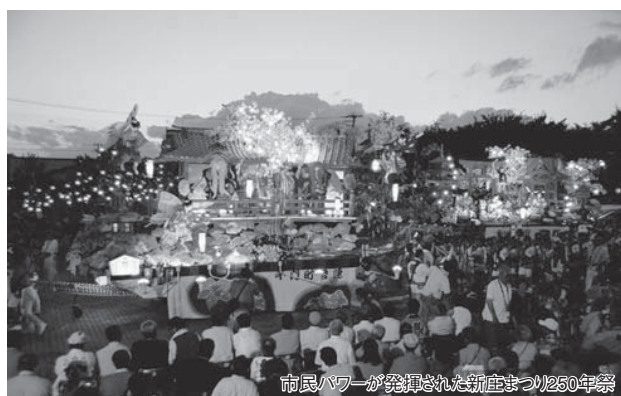
市民パワーが発揮された新庄まつり250年祭

そうしたことから、今後は地方自治体におきましても、これまで以上に「官から民へ」「中央から地方