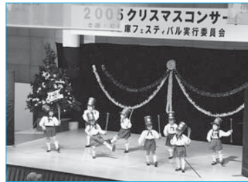
▲クリスマスコンサート(12月22日/ゆめりあ)