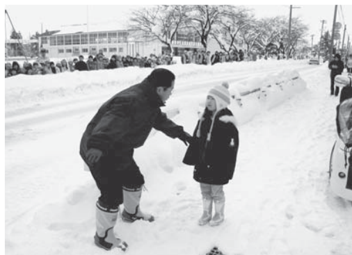
不審者対応訓練(12月14日/新庄小)

そして、さらに大切なことは、教育課題の解決へ向け、教職員が一人丸となることです。