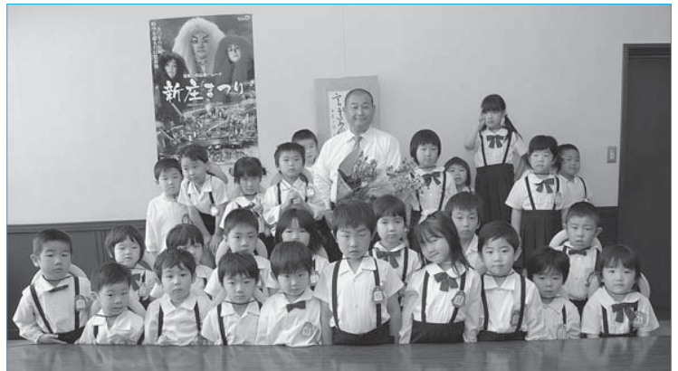
▲マルコ幼稚園児が花の日に花のプレゼント(6月17日／市役所)