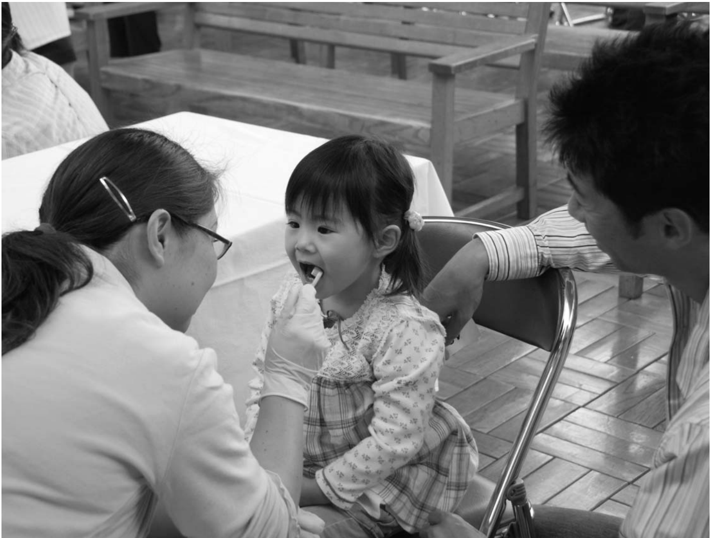
お祭り歯っぴい(6月7日/ゆめりあ)