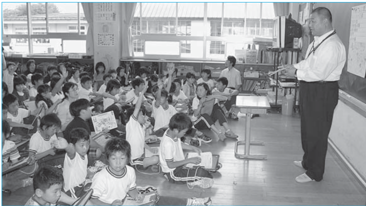
▲30年後の新庄まちづくりプロジェクト(6月19日/沼田小学校)