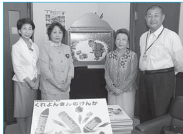
▲国際ソブチミストが大型紙芝居を寄贈(6月19日/市役所)