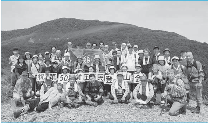
▲第50回市民登山会で参加者による記念写真(6月8日/空蔵山前空蔵)