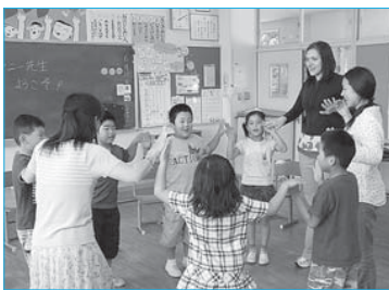
▲アメリカ・コロラド州大学生語学ボランティアによる小学生への英語学習(6月18日/升形小学校)