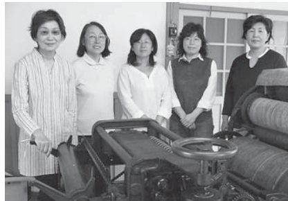
◎新庄ひつじネットワーク 事務局・伊藤 ☎22-4861

新庄ひつじネットワークの活動は今年で十年目を迎えました。ホームスパンとは、手紡ぎ・手織りの毛織物のことで、新庄は戦前から昭和三十年代にかけて旧積雪