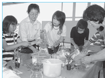
▲かむてん公園まつりでの花みどり講習会(6月22日／かむてん公園)