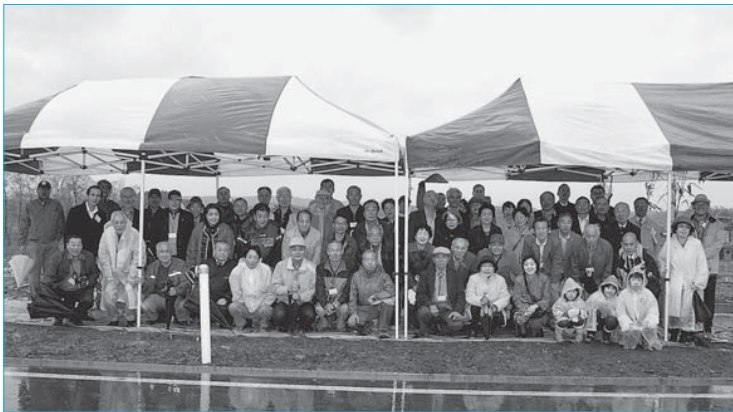
▲「花回廊ようざんろーどをつくる会」が桜を植樹(4月26日/谷地小屋地区)