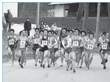
▲第26回新庄・最上地区春季ロードレース(4月5日/陸上競技場周辺)