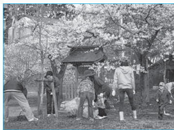
▲ボランティア清掃(4月20日/最上公園)