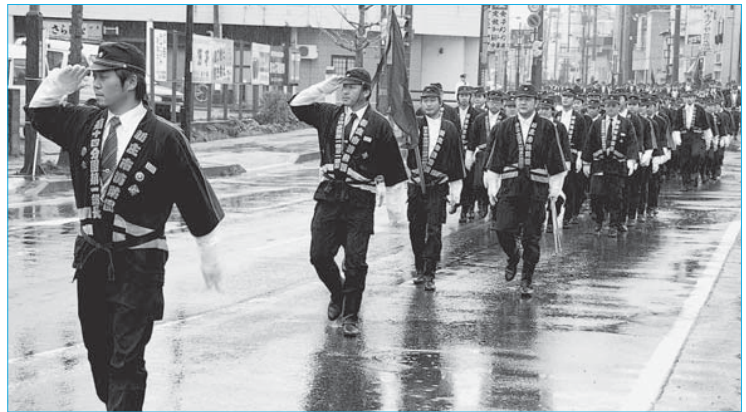
▲悪天候の中で開催された春季消防演習(4月26日/最上公園)