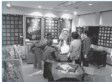
▲刺し子&パッチワーク我楽多作品展(～5月29日/雪の里情報館)