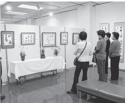
▲龍門書展(4月24日～27日/市民プラザ)

今年も四月に市民プラザで書展を開き、多くの会員が作品を出品しました。書を通じた仲間づくりもわたしたちの大切な活動のひとつです。