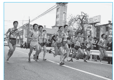
▲第55回県縦断駅伝2日目新庄スタート(4月28日/市役所前)