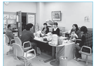
▲各団体の紹介や交流が行われたぶらっとオープンカフェ(4月25日/ぶらっと)