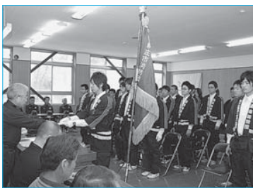
▲市消防団新入団員辞令交付式(4月4日/東山スポーツハウス)