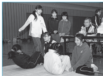
▲「体力に合った運動を」と開催した市民力テスト(4月9日/市体育館)