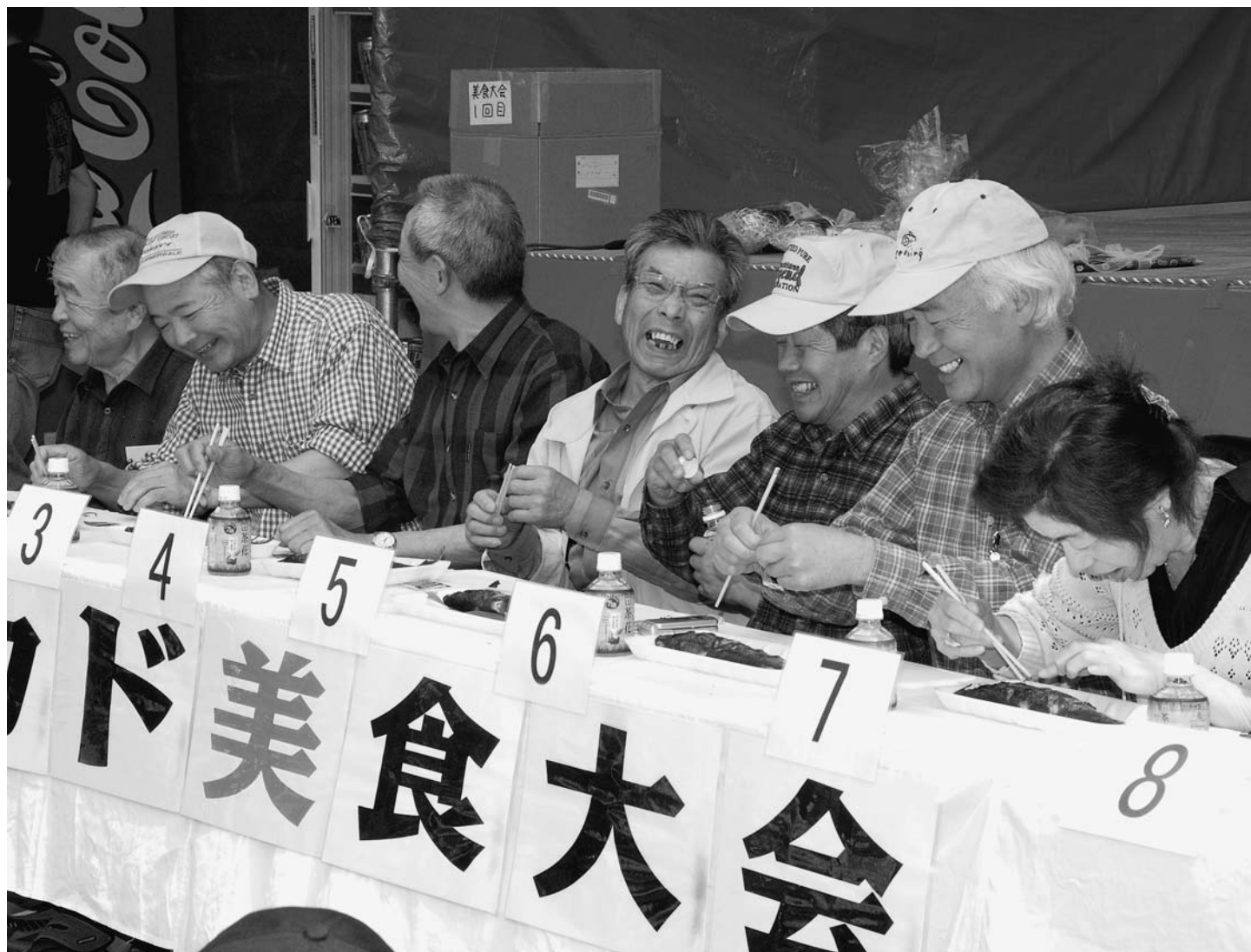
新庄カド焼きまつり「カド美食大会」(5月1日/最上公園)