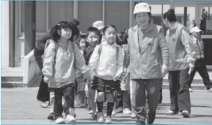
▲新入生交通安全指導(4月9日/新庄小学校)