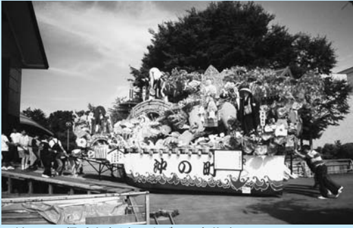
▲沖の町の優秀山車を押し上げる町内若連