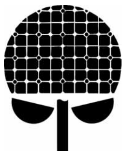
新庄市の花 あじさい