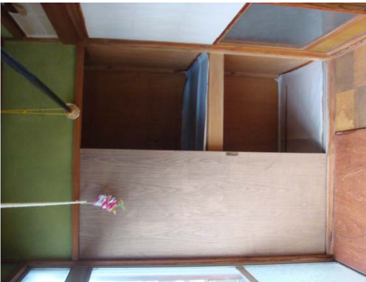
広縁 和室8.0畳続き 収納部分