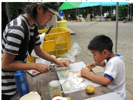
萩野小 宿泊体験学習