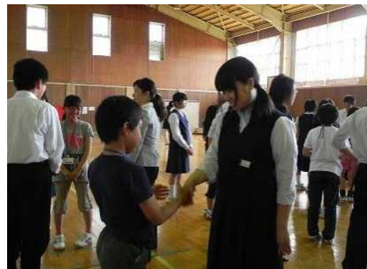
小中交流 外国語活動