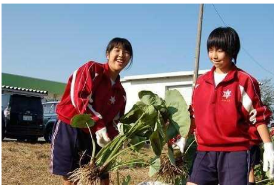
萩野中 ふるさと学習（里芋収穫）