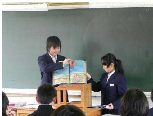
萩野中 読み聞かせ