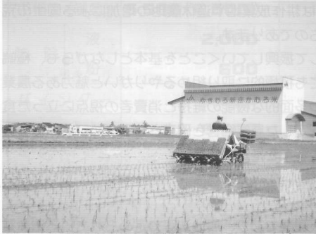
▼ 良質米の田植え(関屋地区)